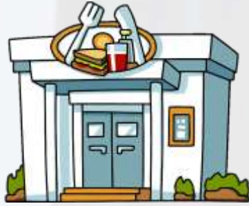
“Mi Barrio Fino”